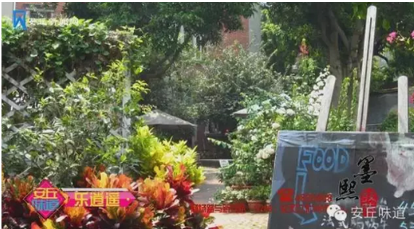
徜徉于曲径通幽的艺术境界