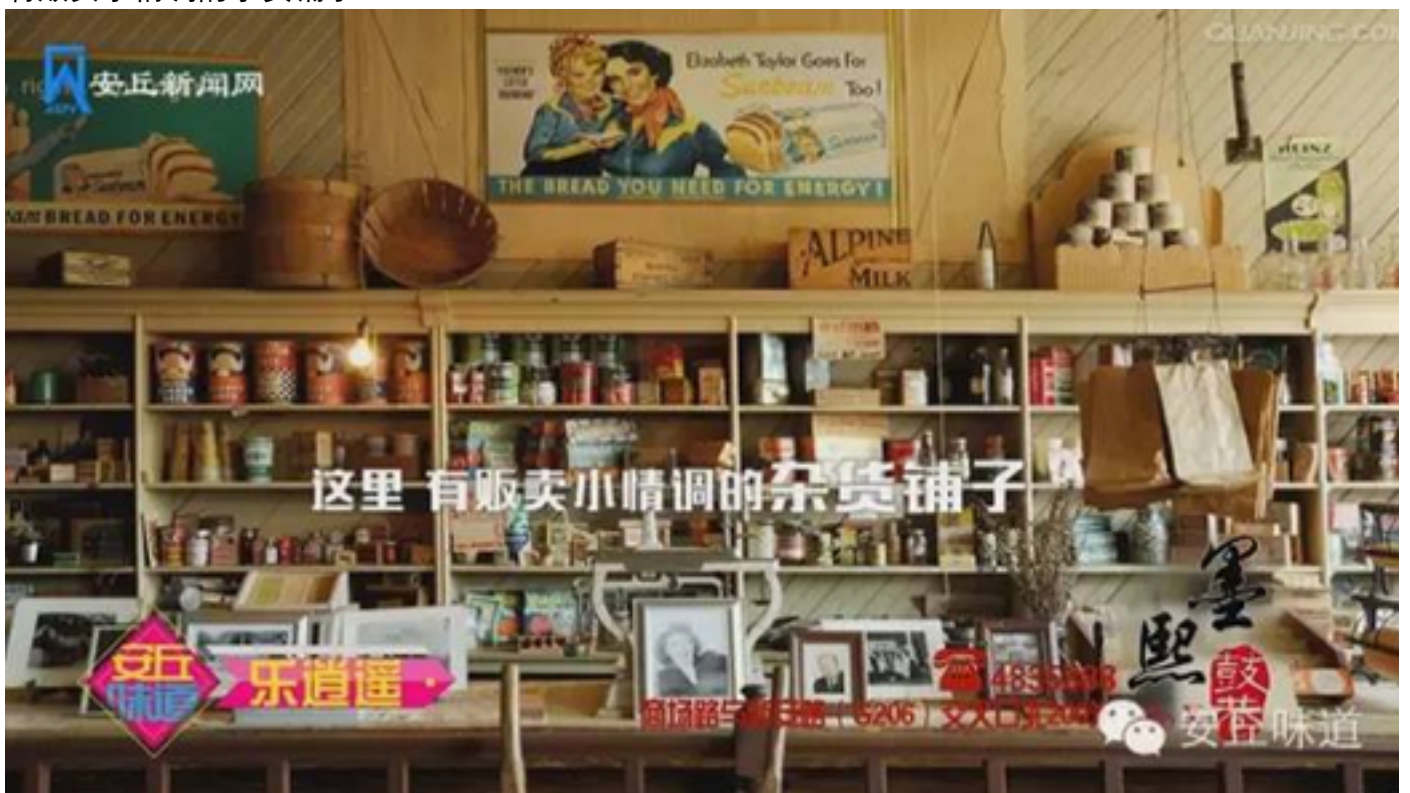
和各种有精神的主题小店