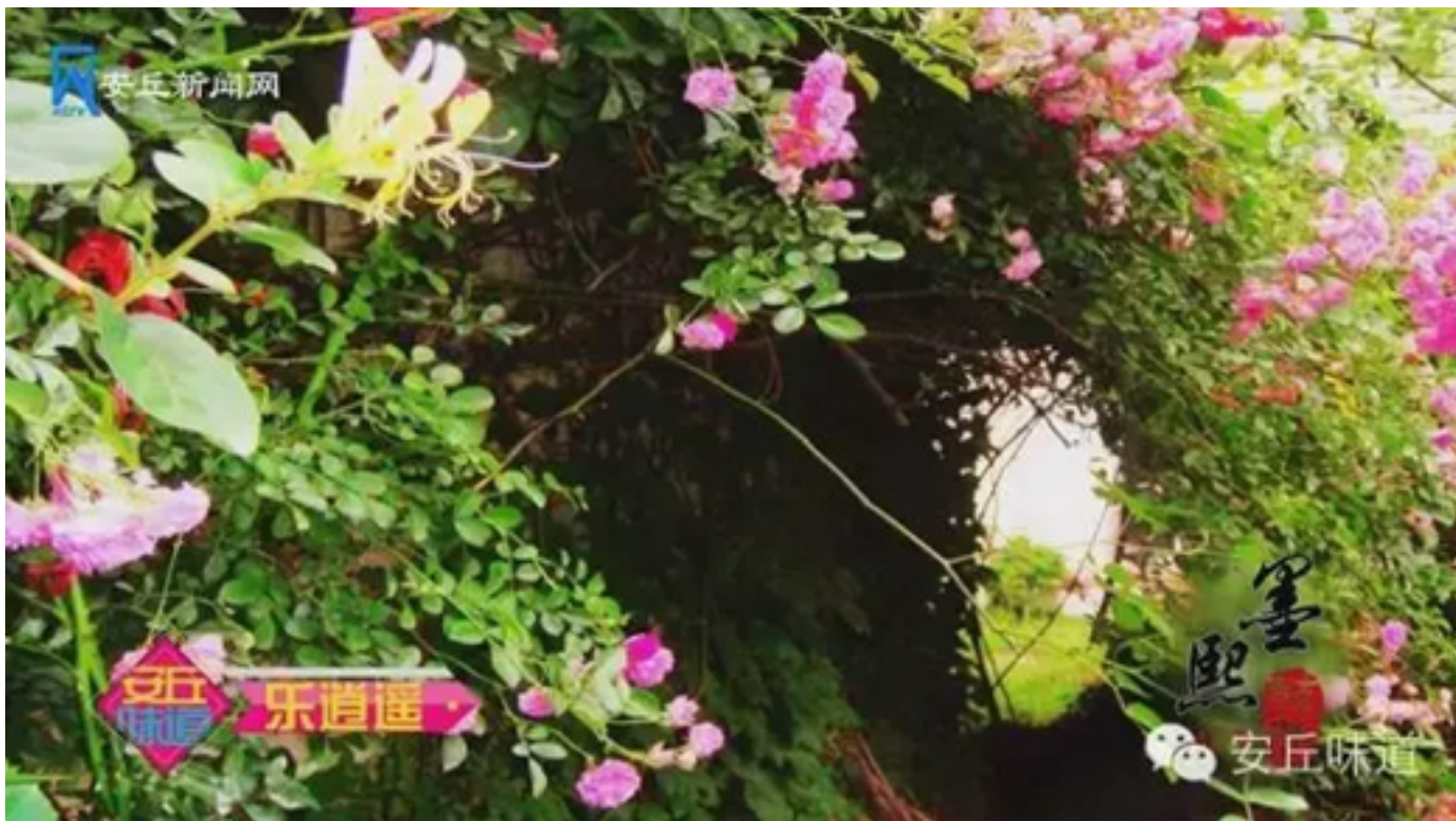
盘桓于人文浓郁的亭台楼阁