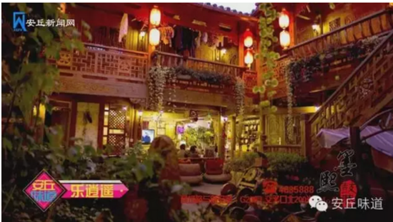
品赏于花木名瑟的山石盛景